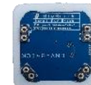
ENV qualità aria