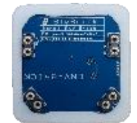
ENV qualità aria